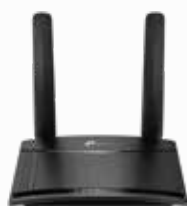
Router Wi-Fi N 4G LTE de 300 Mbps TL-MR100