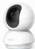
Cámara Wi-Fi Rotatoria de Seguridad para Casa Tapo C200