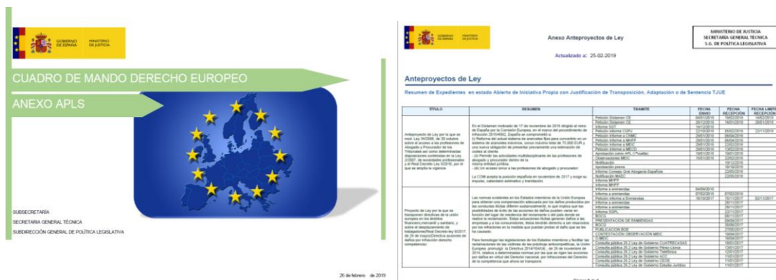
Figura 2. Cuadro de mando de Derecho Europeo